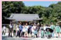
出発前に「はい、パチリ！」