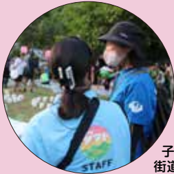
子ども夢 街道での インタビュー

サテライト公開生放送と共に、皆さんの気持ちのこもった “大声”を届けることが出来ました!