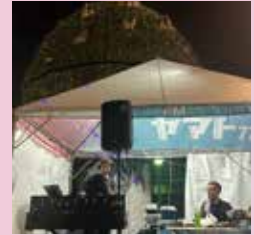
FMヤマトのブースはか らくり時計の前でした

8月6日(日)、香芝高校8時間目 ラジオdeひょうたん 初めての公開生放送を、新しくなった近鉄百貨店橿原店6F「やぎもくひろば」からお届け しました。生徒さんたち、スタジオとは違う表情を見せてくれましたよ。