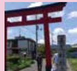
長尾神社の参道へ 戻ってきました！