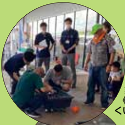
熱戦続く! 《めだかす くい選手権》

8月6日(日)、香芝高校8時間目 ラジオdeひょうたん 初めての公開生放送を、新しくなった近鉄百貨店橿原店6F「やぎもくひろば」からお届け しました。生徒さんたち、スタジオとは違う表情を見せてくれましたよ。