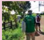
緑したたる中を行く