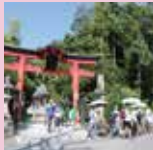
長尾神社から出発！