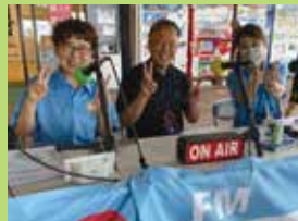
放送前に「はい、ピース!」