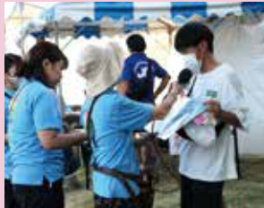
大声コンテストで インタビュー!