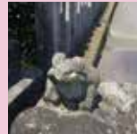
長尾神社境内の 入口にある「なで蛙」

「ガイドと楽しむミニウオーク」は、葛城市観光ボランティアガイドの会主催で、毎月第3日曜日に開催されています。8月は「水面を渡る涼風もとめて!!」というテーマで、長尾神社を出発し、木戸池公園、調田坐一言尼古神社などのポイントでお話をうかがい、ウオークしてきました。