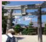
調田坐一事尼古神社